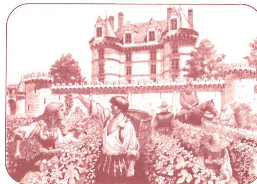
Scène de vendanges devant le château de MARTIGNÉ-BRIAND au XVI siècle. Reconstitution de François DERMAUT.

Ouverture au public, tous les jours en Juillet et Août de 10 h 30 à 12 h et de 14 h à 18 h 30. Visite guidée du château et de ses souterrains. Expositions et animations pendant la saison estivale Théâtre. En Octobre : VENDANGES BELLE EPOQUE Location des salles. Renseignements : Château de MARTIGNÉ-BRIAND 49540 Tél. 41 59 42 59 - 41 59 47 07. En saison : 41 59 44 21